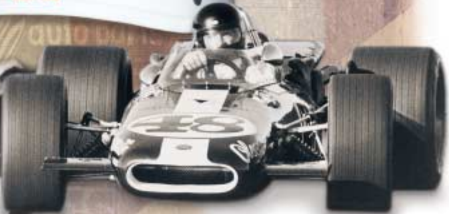
Dan Gurney - First driver to win in the four major racing categories: Formula One, Indy Car, Sports Car and NASCAR